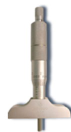
Jauge de profondeur