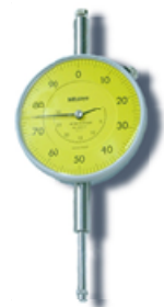
Comparateur à cadran