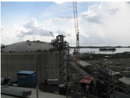
Cameron LNG, USA