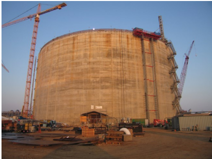
Freeport LNG, USA